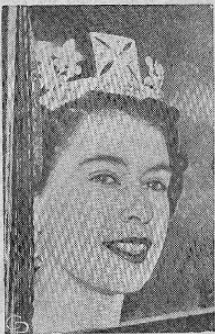
S. M. La Reina Isabel II de Inglaterra